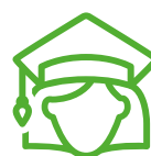
Aus- und Weiterbildung