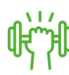
Gesundheit und Fitness