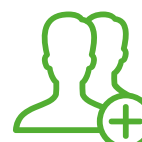
Patent- und Mentoren